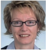
Autorin: Mag. iur. Maria Winkler

Die modernen elektronischen Kommunikationsmittel ermöglichen es den Unternehmen heute, zahlreiche Prozesse durchgängig elektronisch abzuwickeln. Da dabei wegen der fehlenden Medienbrüche einzelne Arbeitsschritte, wie z.B. das Verpacken und Versenden von Briefen oder das manuelle Eingeben von Rechnungsdaten ins IT-System wegfallen, ist das Interesse an der Einführung und Nutzung der neuen Technologien sehr gross. Allerdings herrscht zur Zeit noch beträchtliche Unsicherheit, ob mit der Umstellung auf die elektronische Kommunikation nicht mehr Risiken entstehen, als bisher vorhanden waren. Die mangelnde Identifizierbarkeit des Gegenübers sowie das Risiko der Veränderung von elektronischen Dokumenten während der Übermittlung schafft Verunsicherung und behindert die Verbreitung des elektronischen Geschäftsverkehrs.